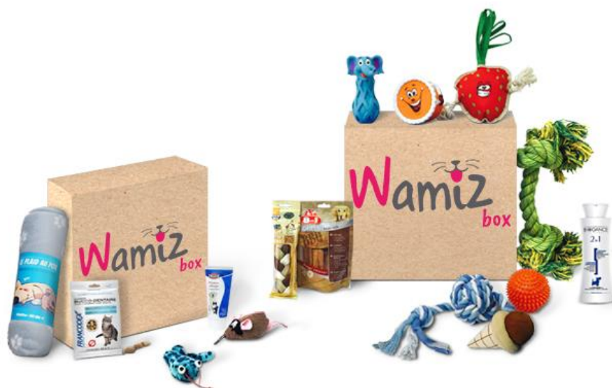
Avec la Wamiz Box, c'est Noël tous les mois pour votre animal de compagnie !

Depuis sa création, Wamiz ne cesse d'innover et de se renouveler pour garantir aux animaux de compagnie et à leurs propriétaires une offre de qualité. En lançant la Wamiz Box, l'équipe souligne une fois de plus sa volonté de renforcer les liens entre les humains et les animaux, tout en usant de son expertise et de son savoir-faire pour ne proposer que des produits d'excellente qualité pour combler toute la famille.